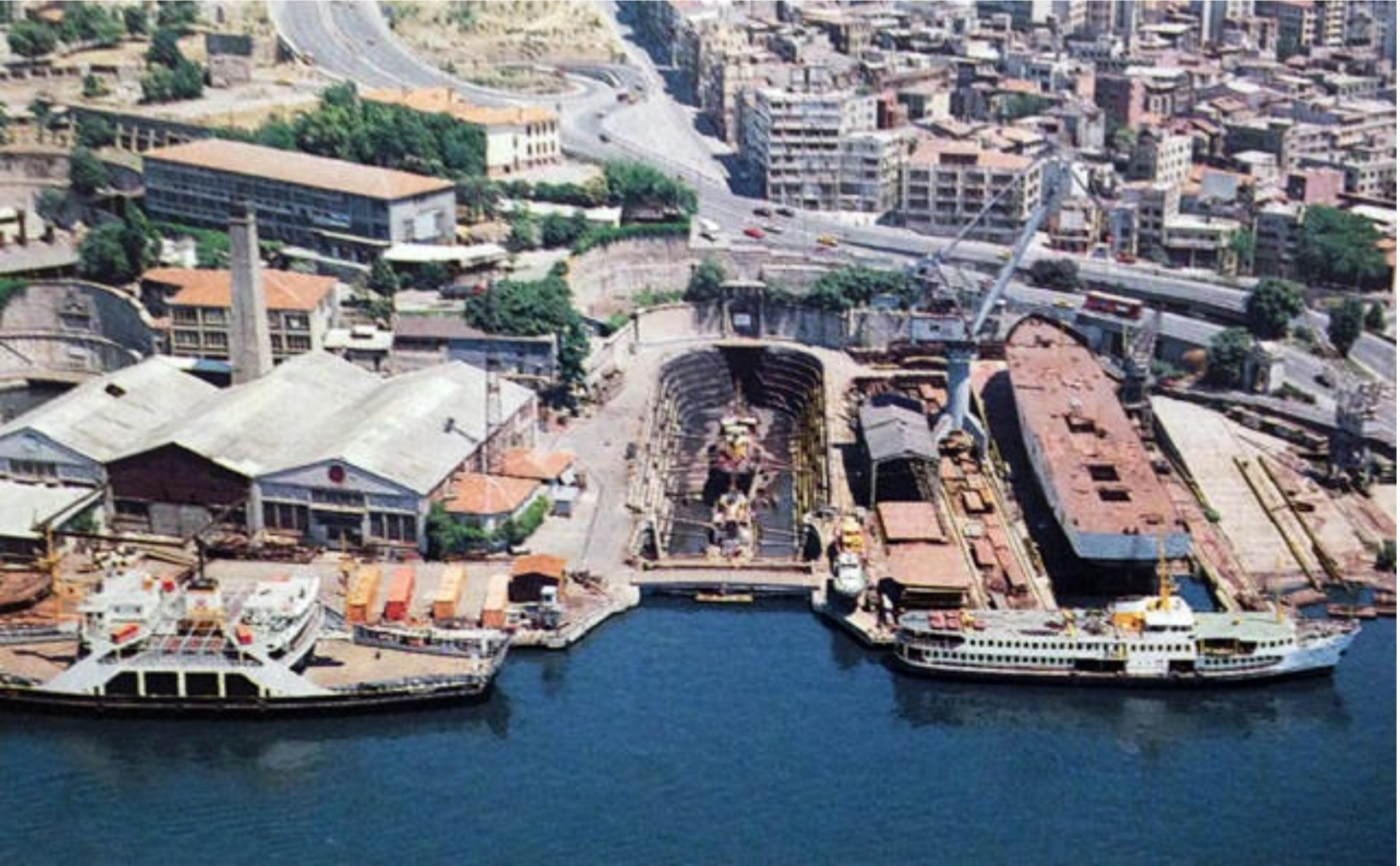
(alıntı kaynak: Haliç'teki Rantsal Dönüşüm Üzerine Raporaj, Politteknik )