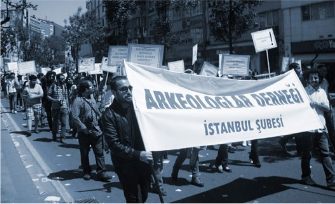
1 Mayıs 2012, Arkeologlar Derneği İstanbul Şubesi korteji (arşiv).