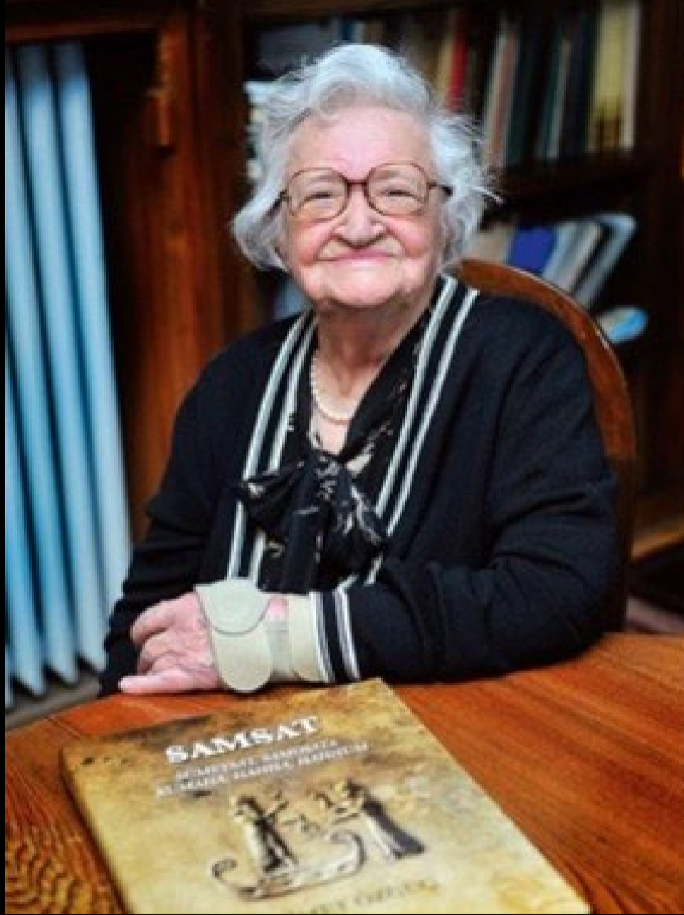
Prof. Dr. Nimet Özgüç (1916-2015)